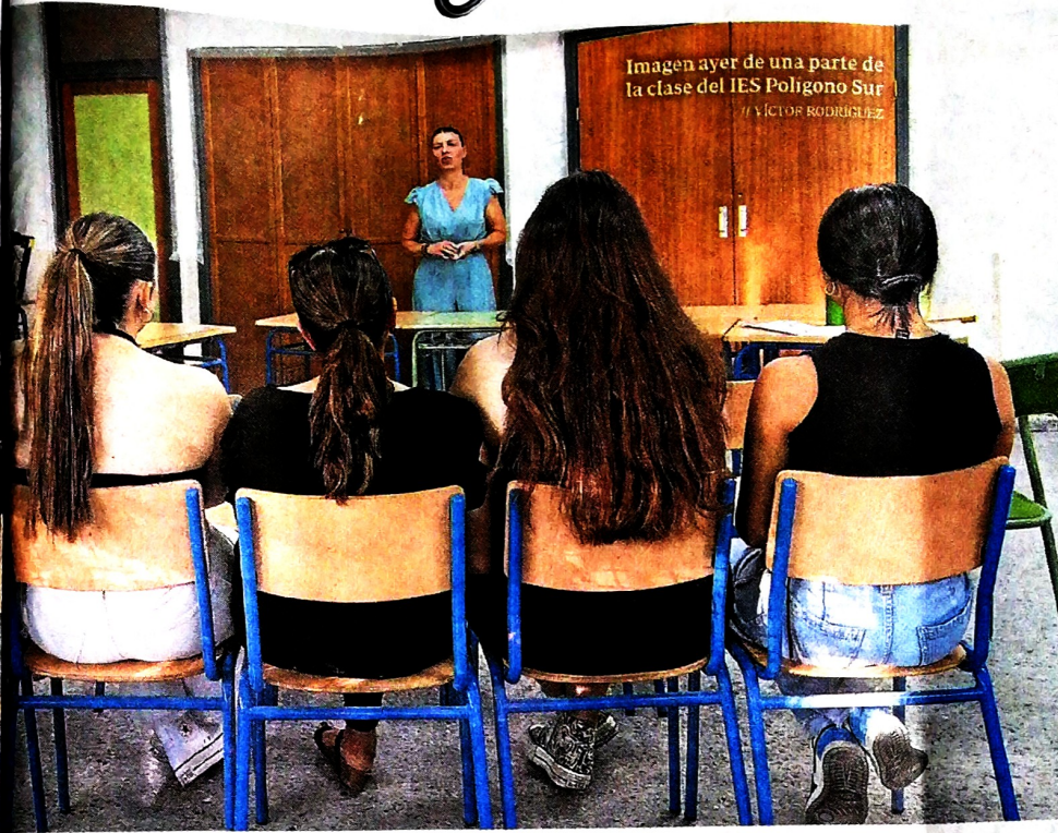
Imagen ayer de una parte de la clase del IES Polígono Sur