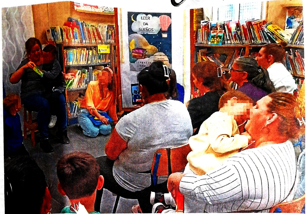
Familiares de los alumnos presencian una actividad realizada en la biblioteca del CEIP Andalucía