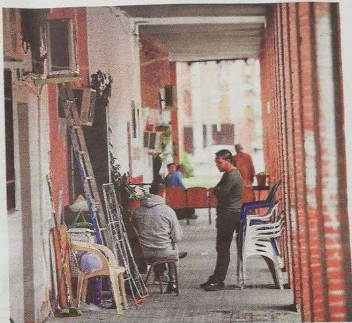
Imagen del barrio de Las Palmeras, en la capital cordobesa

Tampoco sale bien retratada Andalucía en los datos de los municipios con mayores tasas de paro. Las cuatro primeras son andaluzas: Linares, La Línea de la Concepción, Alcalá de Guadaíra y Jerez de la Frontera. En todos el desempleo es, al menos del 26 por ciento. También está en la lista Granada, Dos Her-